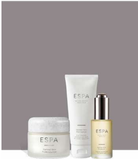
ESPA Natural Beauty/ Inner Calm

Restaura y nutre en un sentido completo con esta inspirada colección de tratamientos personalizados de los expertos en spa de renombre mundial ESPA Facials Reveal, una piel que brilla cada día con salud y belleza natural. Evaluando su piel, su estilo de vida y sus necesidades de bienestar, nuestros expertos de ESPA crean un tratamiento facial verdaderamente personalizado y centrado en los resultados, utilizando las últimas técnicas innovadoras con nuestras poderosas mezclas Tri-Active™. Los resultados son instantáneos y duraderos: la piel se ve clara, radiante y se restablece.